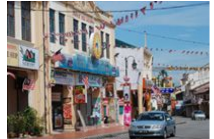
マラッカの街並み

A 質問やクレームはまったくありませんでした。毎年一度、保護者の方には修学旅行説明会を開いています。今回は行き先を変更したことや船を利用することを考慮して、5月と9月の二度行ないましたが、特に反対意見は出ませんでした。察するに、マレーシアにまだ馴染みがないので、まず実施してみないことには何とも言いようがなかったのかもしれませんが。行って帰ってきてから生徒本人に聞こう、という心境でしょうか。