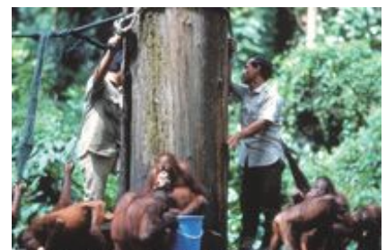
セビロックオランウータンリハビリセンター（ボルネオ島）

これまでの修学旅行はどうしても歴史学習が中心となり、日本の歴史を振り返る学習、つまり相手国よりむしろ日本を学ぶ時間が多くなっていました。今回マレーシアで実施してみて、歴史だけでなく、風土や暮らしなど「マレーシアそのもの」の学習素材が多かったと感じています。