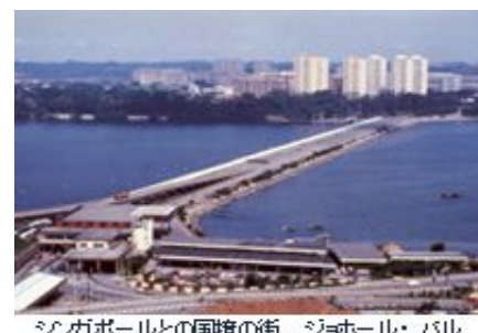
シンガポールとの国境の街、ジョホール・バル

A 今回は、機中1泊、シンガポールからマラッカへ渡るときの船中1泊と、変則的な宿泊が含まれる日程でした。また、例年は全員で市内から関西空港へ向かうのですが、今回は関西空港に直接集合することになりました。そこで予行練習として、関西空港前のワシントンホテルに1泊する 宿泊行事を事前学習に採り入れた のです。修学旅行と同じように空港に直接集合し、ホームビジットのグループメンバーで泊まり、食事はホテルにお願いして、バイキングに東南アジア風の料理を用意していただきました。