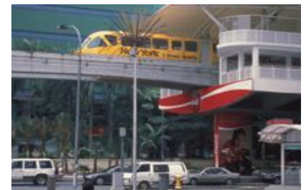
クアラルンプール市内

A 今回の実施はマラッカとその郊外の村のみとなりましたが、下見ではクアラルンプール（KL）もまわりました。KLで民俗芸能の鑑賞もできるほか、マレーシアにはオランウータンもいますし、マレー鉄道など鉄道路線も充実しており、オプションがいろいろと可能なので気になっています。次回はもう少し工夫していきたいですね。