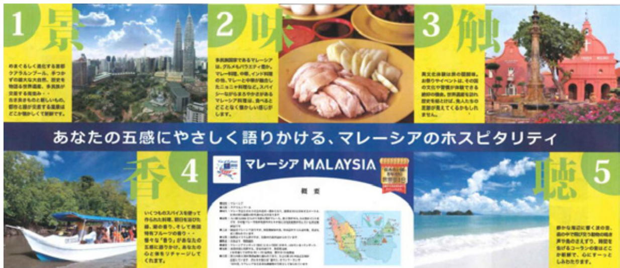
マレーシア政府観光局・観光 PR ブースのパネルイメージ

マレーシア政府観光局（東京支局：東京都千代田区、東京支局長：ノール・アズラン）は、マレーシア・イヤー・オブ・フェスティバル 2015（Year of Festivals 2015）の最初の記念イベントとして、来る 2015 年 2 月 5 日（木）～11 日（水・祝）までの 7 日間に渡り開催される「第 66 回さっぽろ雪まつり」/11 丁目広場にマレーシア料理と PR & 物販ブースを出展し、観光 PR を展開いたします。